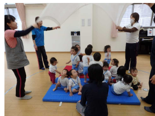
～布がふわふわ、体もふわふわ表現をたくなります～